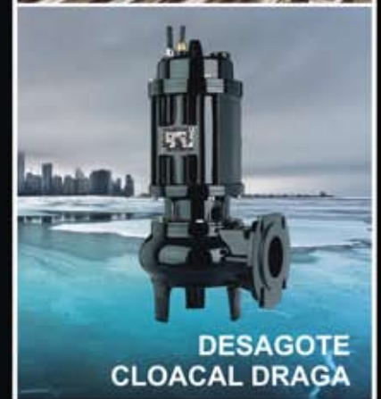
DESAGOTE CLOACAL DRAGA