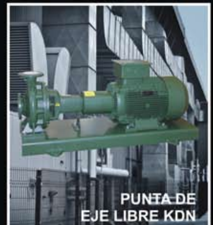
PUNTA DE EJE LIBRE KDN