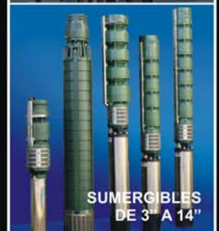
SUMERGIBLES DE 3" A 14"